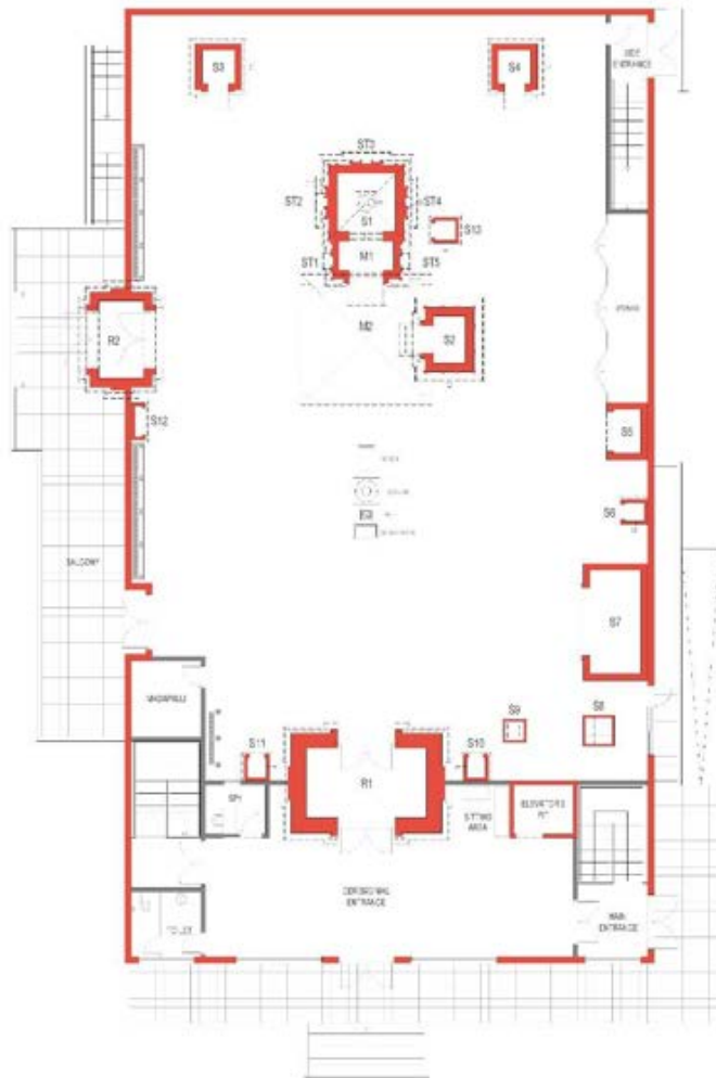
Main Floor of New Temple