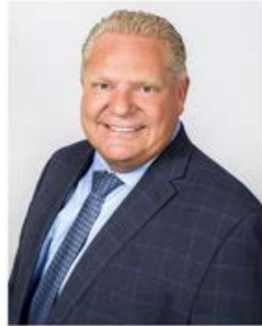
Doug Ford Premier